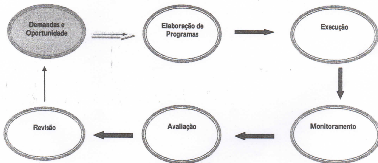
Figura 2 – Ciclo de Gestão do PPA